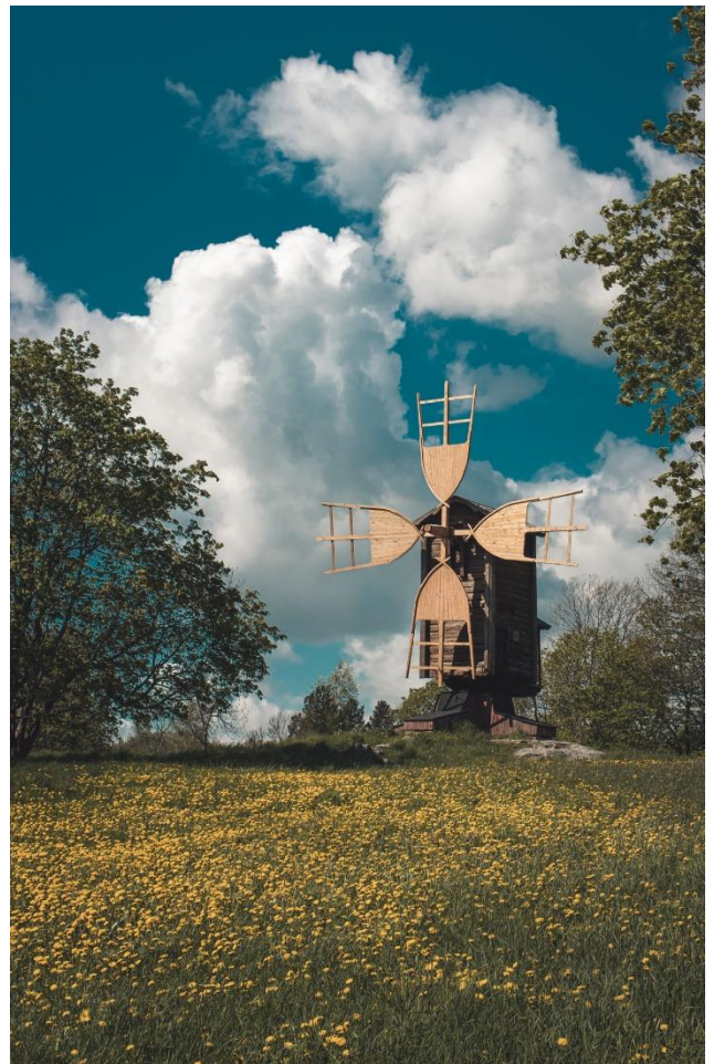
Tuulimylly Vanhankylänniemessä

Vuonna 2021 pandemiasta johtuneet rajoitus- ja sulkutoimenpiteet ovat vaikuttivat merkittävästi kulttuuri- ja tapahtumapalveluiden sekä museopalveluiden toimintatuottojen laskuun. Myynti- ja maksutuottojen määrä vuonna 2021 oli -309 538 € sisältäen museo- ja kirjastopalvelut sekä Järvenpää Opiston. Rajoitus- ja sulkutoimenpiteet vaikuttivat erityisesti kevääseen sekä uudestaan loppuvuoteen 2021. Toimintatuotot ovat vain yksi osa hyvinvoinninpalvelualueen taloudellisia lukuja eivätkä yksittäisenä lukuna kerro riittävästi palvelualueen taloudellisesta tilanteesta. Haastavassa tilanteessa kulttuuri- ja tapahtumapalvelut ovat pyrkineet toimimaan rajoitusten puitteissa niin, että kuntalaiset ovat päässeet taiteen ja tiedon äärelle mahdollisimman monipuolisesti. Kirjastopalvelut ovat pystyneet toteuttamaan toimintaansa pitkien aukioloaikojen turvin porrastetusti läpi vuoden. Alla olevassa taulukossa on tuotu esille kulttuuri- ja kirjastopalveluiden toiminnan lukuja vuosilta 2019–2021. Kirjaston palveluita on käytetty fyysisesti vähemmän kuin aiempina vuosina, mutta aineiston lainaamiseen se ei ole juuri vaikuttanut. Kulttuuripalvelut ovat onnistuneet kasvattamaan vuonna 2021 huomattavasti niin tapahtumien määrää kuin niihin osallistujien määrää.