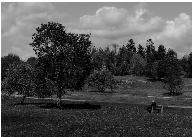
Kuva Ursula Arsiola, Vanhankylänniemi

Vuoden 2021 hyvinvointikertomus ei avaa suoranaisesti luvuin tai mittarein, miten tapahtumat ja kulttuuripalvelut ovat olleet tukemassa kuntalaisten hyvinvointia. Kärkitavoitteet hyvinvoinnin kehittämisessä vuosille 2020–2021 ovat olleet vahvemmin terveyden edistämisessä. Järvenpään osallisuusmalli 2021–2015 puolestaan keskittyy tapahtumien osalta rakentamaan matalan kynnyksen toimintamahdollisuuksia kuntalaisille, toimijoille ja kulttuurintekijöille viestinnän keinoin sekä tilamahdollisuuksin.